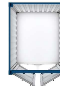
Pos 24) LC10