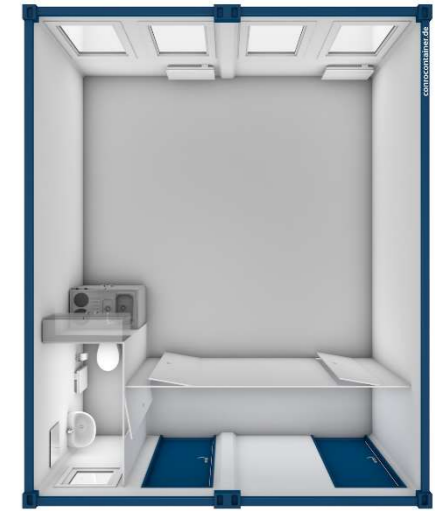
Pos 9) BM9