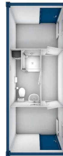
Pos 16) SA9