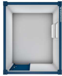
Pos 01) BM1