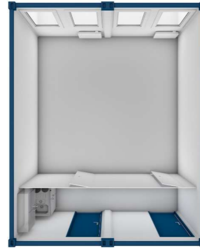
Pos 07) BM7