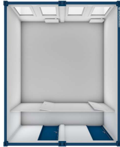
Pos 06) BM6