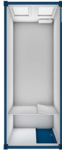
Pos 02) BM2