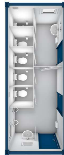
Pos 14) SA5