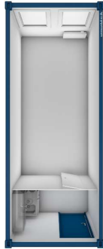
Pos 03) BM3