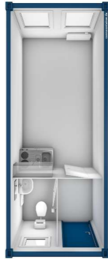
Pos 05) BM5