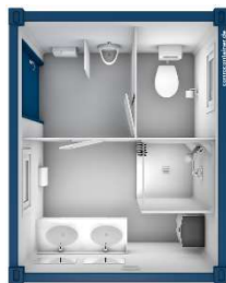
Pos 10) SA1