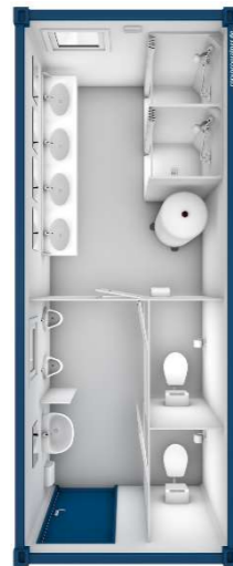
Pos 12) SA3