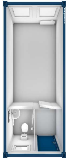
Pos 04) BM4