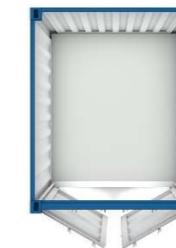
Pos 24) LC10