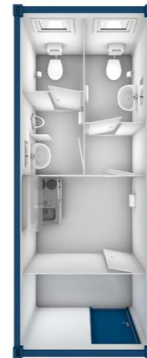
Pos 15) SA6