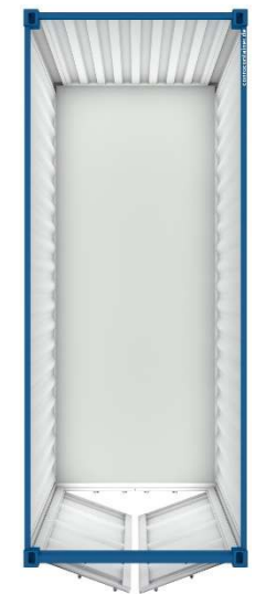
Pos 25) LC20