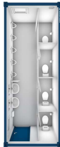
Pos 13) SA4